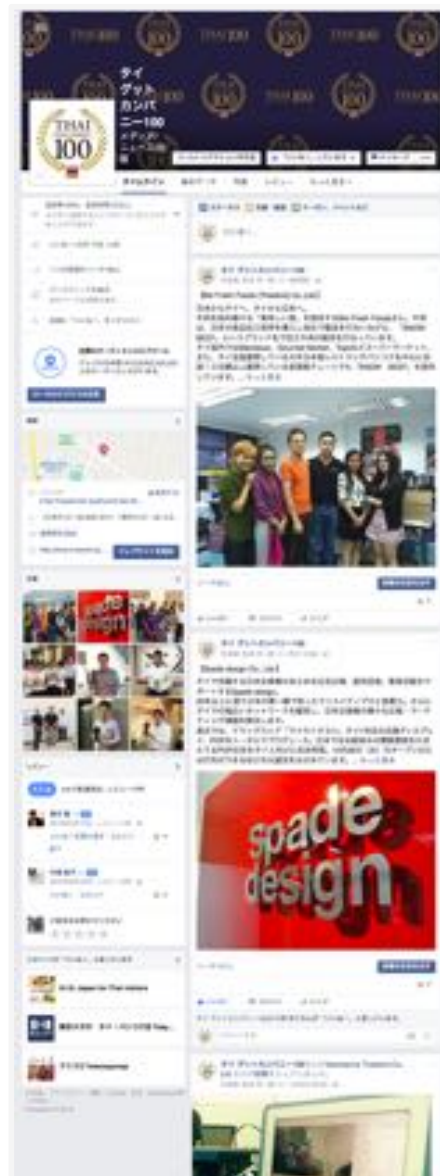
THAI GOOD COMPANY 100 Facebook http://www.facebook.com/THAI.GoodCompany100