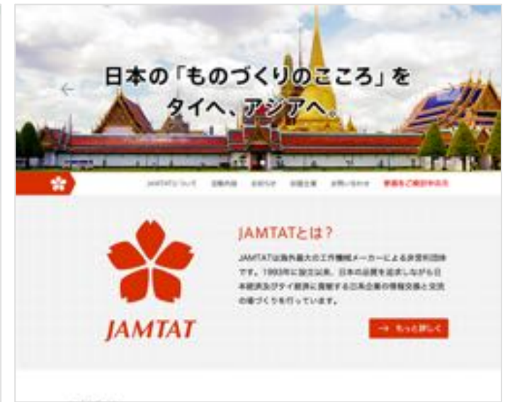
JAMTAT オフィシャルサイト http://www.jamtat.com/

Miyathai Tradingは、切削油剤、パレル研磨設備、消耗品、火災報知設備、刻印機を中心に販売している機械の商社です。