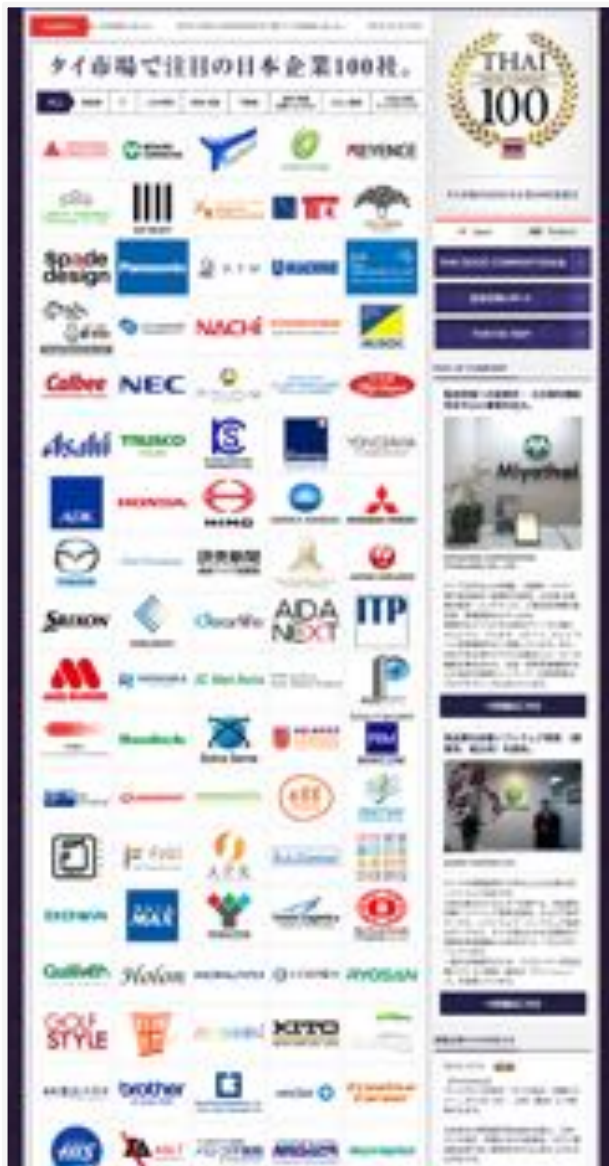
THAI GOOD COMPANY 100 http://www.k-tsushin.jp/thai100/