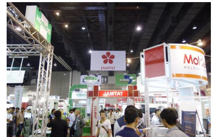
タイで行われたASEAN地域最大級の工作機械・金属加工の展示会「METALEX 2014」

MOS BURGERタイのカウンター上に表示されるデジタルサイネージ（映像）です。MOS BURGERは、工業ではありませんが、日本の食文化、そして日本のモノづくりをコアコンピタンスにしている会社です。