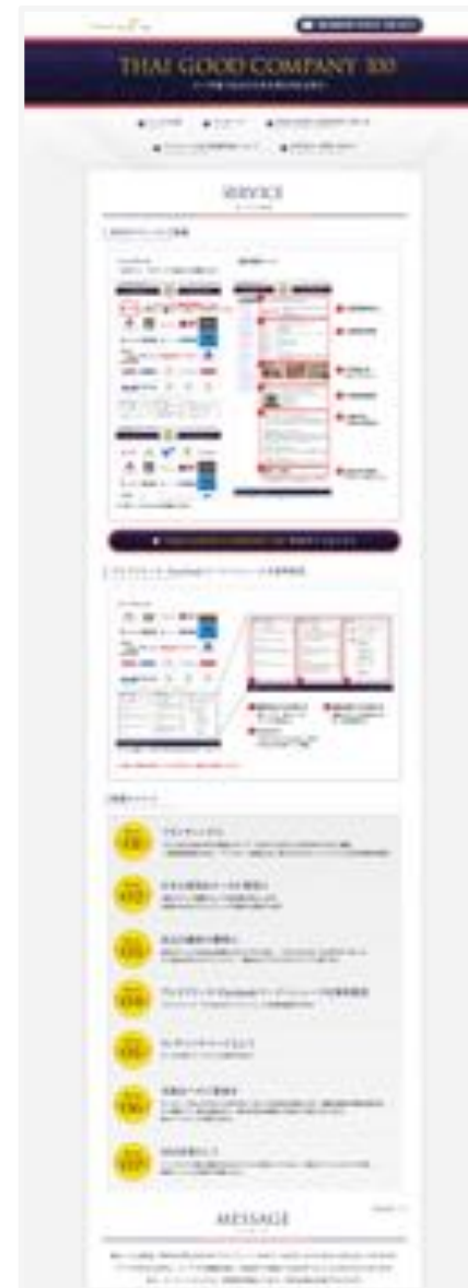
THAI GOOD COMPANY 100 サービス紹介 http://www.e-bird.biz/thai100/