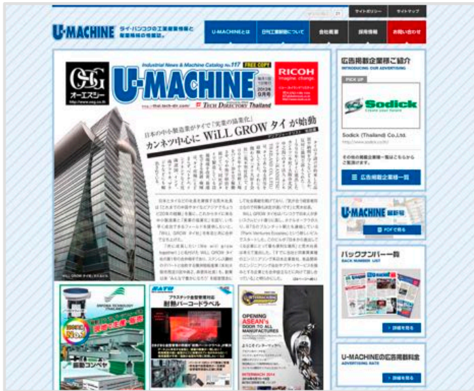
「U-MACHINE」オフィシャルサイト http://www.u-machine.net/

「U-MACHINE」は、タイで活躍する製造業に携わる日本人に向けて情報発信を行っている日本語工業月刊誌です。創刊10年目を迎え、タイで製造業に携わる日本人で知らない人はいないとっても過言ではない媒体です。